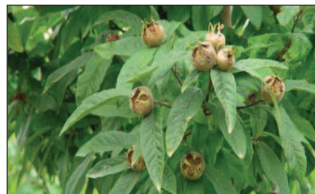
gesunde Mispel ( Mespilus ) mit Früchten

Feuerbrandmeldestelle in Ihrer Wohngemeinde: