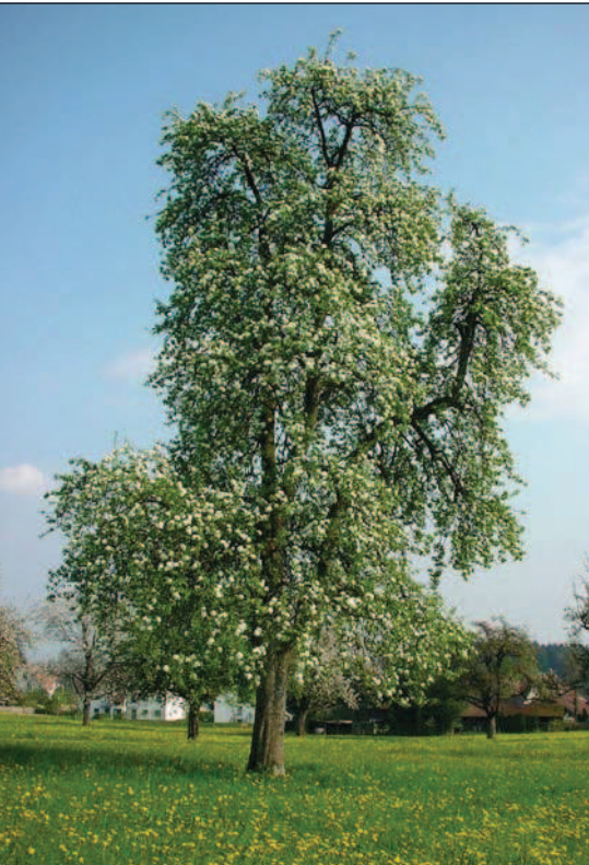
Der Feuerbrand bedroht auch die Kernobst-Hochstämme und damit das Landschaftsbild.

Feuerbrand ist eine gefährliche, meldepflichtige Pflanzenkrankheit, die durch Bakterien verursacht wird. Grosse wirtschaftliche Schäden können in Obstanlagen, Baumschulen und Hochstammobstgärten entstehen. Wild- und Ziergehölze tragen als Infektionsquellen wesentlich zur Ausbreitung der Krankheit bei. Für Cotoneaster und Photinia davidiana (Lorbeermispel) besteht seit 1. Mai 2002 eine schweizerische Verordnung, welche Produktion, Inverkehrbringen und Pflanzung verbietet. Einzelne Kantone haben dieses Verbot auf weitere Feuerbrand-Wirtspflanzen ausgeweitet.