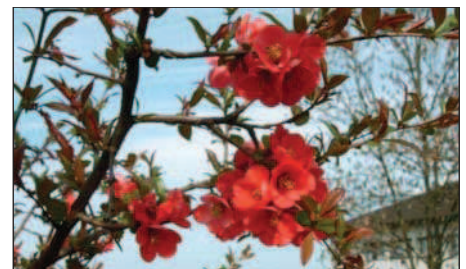
Feuerbusch (Scheinquitte bzw. Chaenomeles ) der sehr früh blüht.