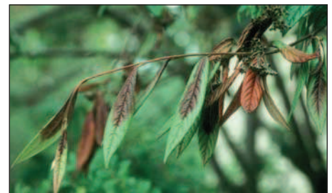
Cotoneaster salicifolius mit typischen Feuerbrand-Symptomen.