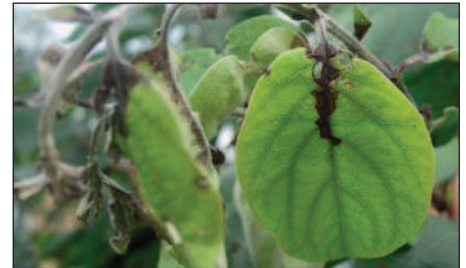
Quitte mit verdächtigem Symptom, Verbräunung vom Blattstiel her.

Feuerbrand ist eine meldepflichtige Krankheit!