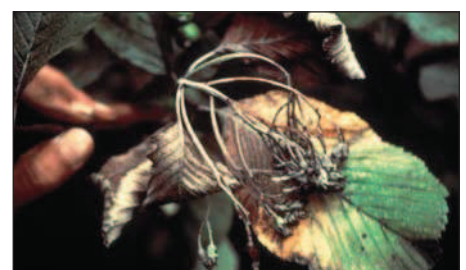
Mehlbeere ( Sorbus aria ) nach Blüteninfektion.