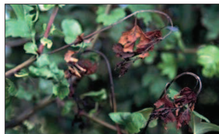
Weissdornzweig ( Crataegus ) mit Feuerbrand