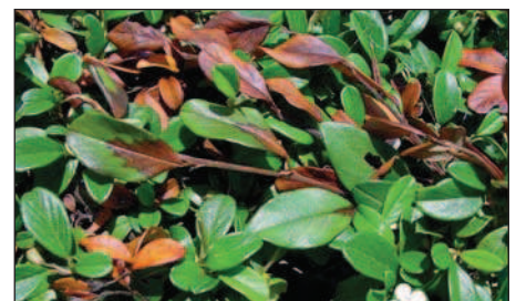
Cotoneaster dammeri (Bodendecker) mit Feuerbrandbefall.