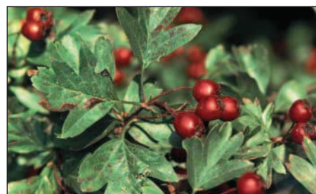
gesunder Weissdorn ( Crataegus )