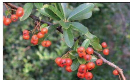
gesunder Feuerdorn ( Pyracantha )