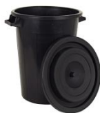
Beispiel: Geeignetes Grüngutgefäss

Kunststoffässer, Säcke, Zeinen oder andere Container sowie nicht gebündeltes Stauden- und Baumschnittmaterial werden nicht abgeführt.